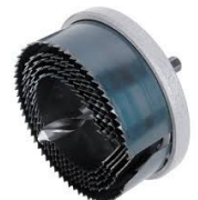
Broca de corona